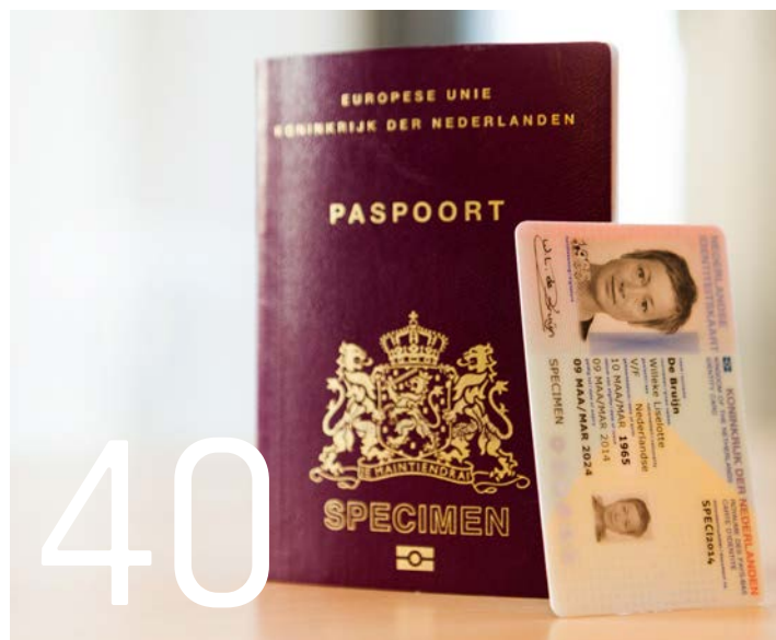
Identiteitsfraude: wat kun je daartegen doen?